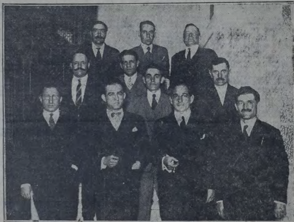
DELEGADOS DE LOS TERRITORIOS NACIONALES